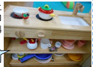
男女問わず人気のおままごと

性別や好みによって子どもがハマるおもちゃは様々ですが、やはり子どもの発達段階にあわせたおもちゃが面白く感じるようですね。発達の目安は母子手帳やのんびりんこのひろばにも掲示してありますのでたまに気にしてみるのも目安になりますね。のんびりんこにもいろんな種類のおもちゃを置いてありますので、遊びに来た時には参考にしてみてくださいね。