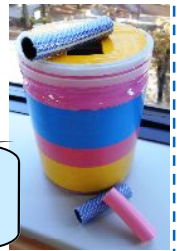
手作りの ポットンおもちゃ

欲しいおもちゃに手を伸ばして自分で移動する等意図した動きが増え、遊びの幅も広がりますね。“穴に入れる”→“型にはめる”と遊びもステップアップしていきます。