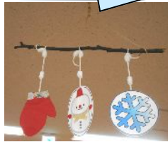
飾り隊の 手作りのモビール

のんびりんこの赤ちゃんコーナーにもいろんなタイプのおもちゃがあります。天井のモビールもよく赤ちゃんが見ていますよ♪また、この時期、ママの声をたっぷり聞かせながらの手遊び・体遊びは赤ちゃんにとって刺激があり、安心・安全なあそびです。