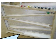
人気のスロープトイ

1歳を過ぎると手先が器用になり、小さなおもちゃで遊び始めます。のんびりんこでもレールのおもちゃなどが人気です。